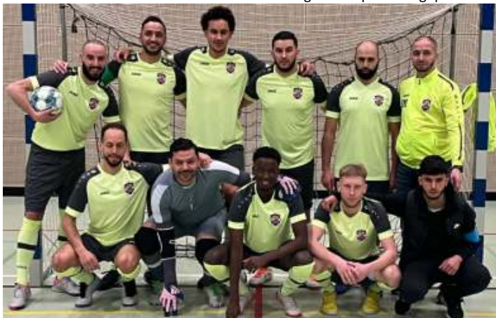
2A * ASJ BERCHEM