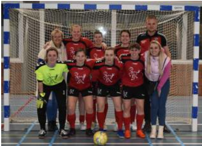
Beker van België – Coupe de Belgique 11.02.2023 * RAPID G BEERN – ST MARIE 87 3 – 1.