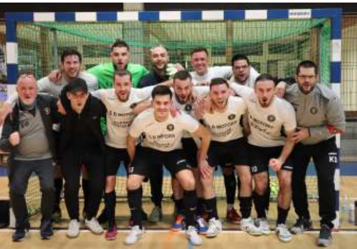
SHAAB RAMILLIES après la victoire dans le derby face à ME WAVRE LIMAL