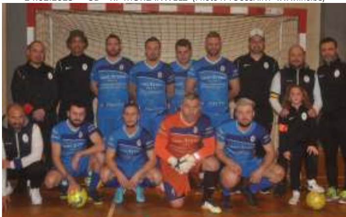
24.02.2023 * 3B * SICILE PD LOUP