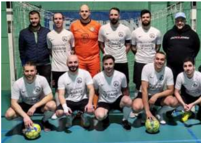
24.02.2023 * 3B * RP MORLANWELZ