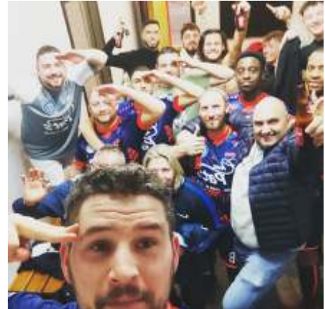
MF OREYE après la qualification en coupe de Belgique face à B WOLV BETEKOM 2 – 2 (3-2)